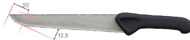
Figure 28. Préconisation de la largeur de la lame