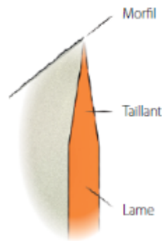
Figure 9. L'émorfilage